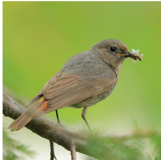
Hausrotschwanz mit Futter für Nachwuchs