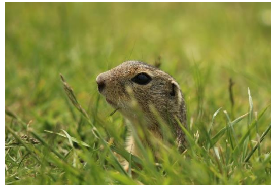
Das seltene Ziesel – eine Erdhörnchenart im Südosten Österreichs