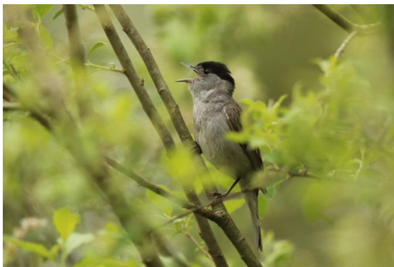
Mönchsgrasmücke - Männchen