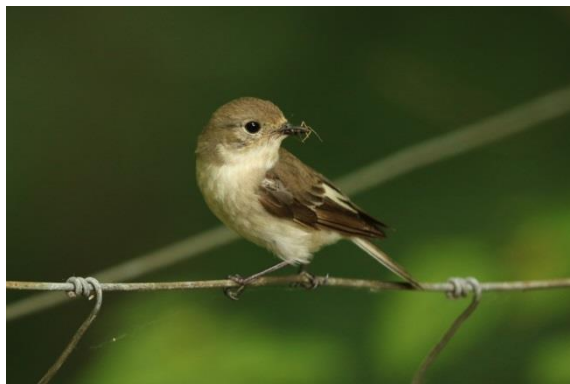
Trauerschnäpper - Weibchen