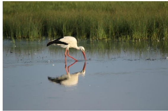
Gespigelter Weißstorch am Reinheimer Teich