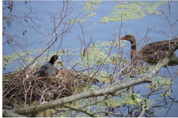
Brütendes Blässhuhn auf dem Steinbrücker Teich etwas gestört durch die Annäherung der Graugans