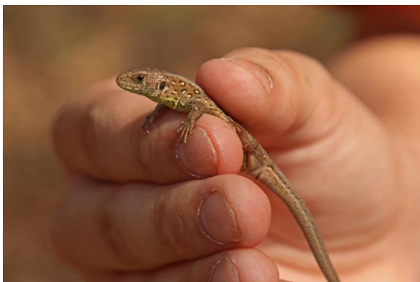
Eine aus der Winterruhe kommende kleine Zauneidechse

Am 2. April traf sich der neu gewählte Vorstand zu seiner konstituierenden Sitzung. Hauptthema waren die organisatorischen Veränderungen, die mehr Mitgliederbeteiligung bringen sollen. Es wurde entschieden, die unten stehenden Projektgruppen (PG) zu bilden.