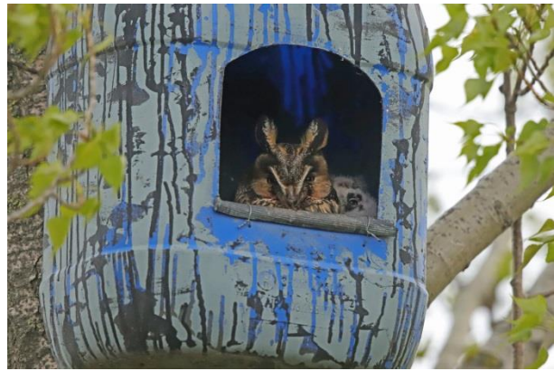
Waldohreule im Fertighaus