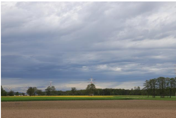
Derzeitige Ackerfluren in Wixhausen

Unsere Fragen: Haben Betriebe mit ökologischen Zielen etwa geringere Auswirkungen auf die Versiegelung und sind sie emissionsfrei? Welche Betriebe haben denn bisher Bedarf für neue Gebäude oder Flächen angemeldet? Sollen Gewerbeflächen, die nicht durch solche Betriebe genutzt werden, hinterher brachliegen?