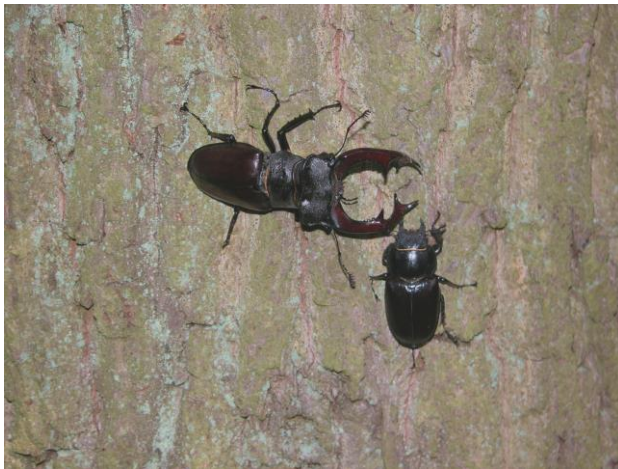
Hirschkäfer – links Männchen, rechts Weibchen

An zwei weiteren Insektenarten besteht großes Interesse seitens unserer NABU-Gruppe, unabhängig wann und wo sie in der Region gefunden werden.