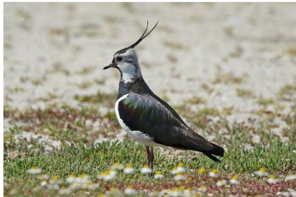
Kiebitz – eine stark bedrohte Vogelart